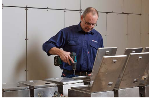
Høj kvalitet gennem hele produktionsforløbet.