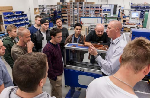
Videndeling i fokus med seminarer for kommende el-installatører.